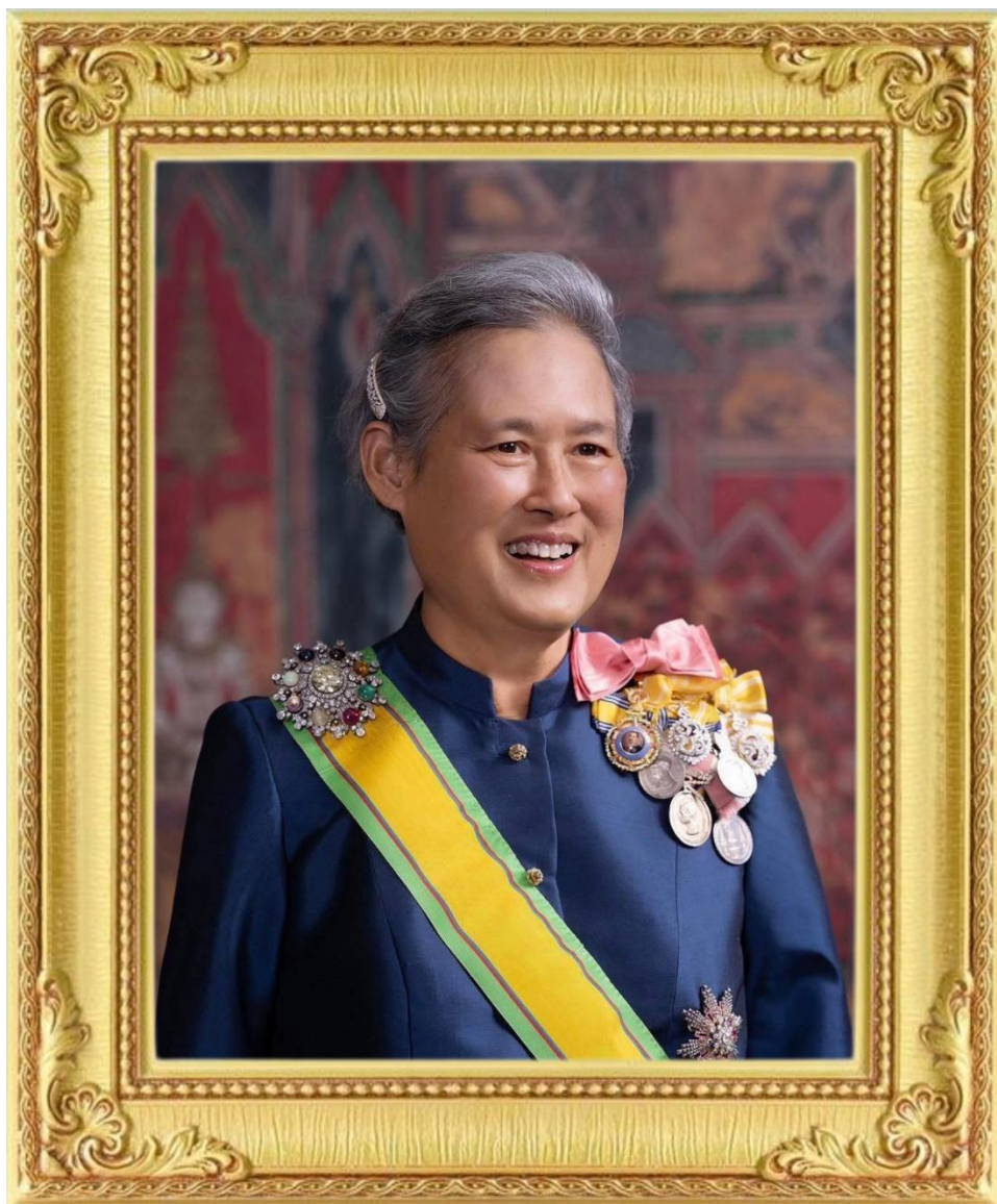
สมเด็จพระกนิษฐาธิราชเจ้า กรมสมเด็จพระเทพรัตนราชสุดาฯ สยามบรมราชกุมารี องค์ประธานมูลนิธิส่งเสริมโอลิมปิกวิชาการและพัฒนามาตรฐานวิทยาศาสตร์ศึกษา ในพระอุปถัมภ์สมเด็จพระพี่นางเธอ เจ้าฟ้ากัลยาณิวัฒนา