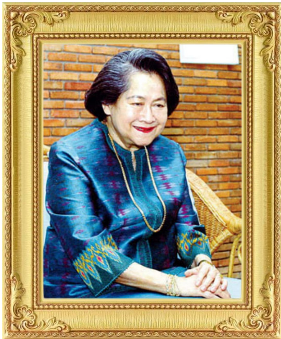
สมเด็จพระเจ้าพี่นางเธอ เจ้าฟ้ากัลยาณิวัฒนา กรมหลวงนราธิวาสราชนครินทร์ องค์ผู้ก่อตั้งมูลนิธิ สอวน. และประธานมูลนิธิ สอวน. พระองค์แรก